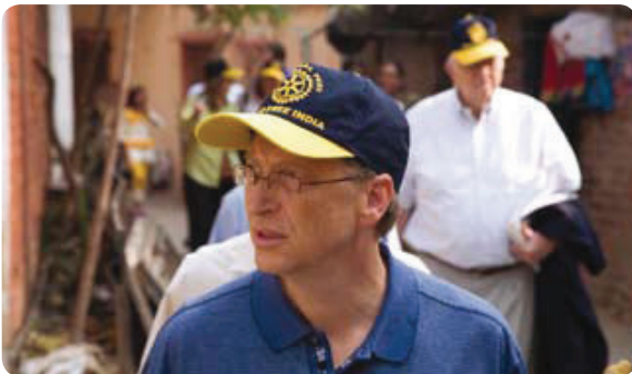
Bill Gates « fils » (accompagné de Bill Gates « père », derrière) assiste à une journée nationale de vaccination en Inde. La casquette Rotary qu'il portait a ensuite été dédicacée et vendue aux enchères pour $17 600.

La Fondation Bill & Melinda Gates a annoncé un nouveau don de US $150 millions à utiliser en 2008 et 2009, et a encouragé les dirigeants du G8 à traduire leur engagement en faveur de la lutte antipoliomyélique en « ressources financières bien réelles ». Cette contribution porte le montant total des contributions de la Fondation à l'IMEP, y compris les subventions de contrepartie fournies au Rotary International, à US $655 millions.